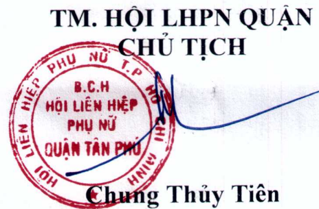
Chung Thủy Tiên